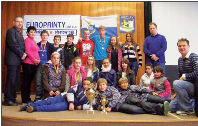
Nejlépe umístění se stalo družstvo ZŠ Kupkova.

pouze o tři body před ZŠ Na Valtické, třetí skončila ZŠ Kap. Nálepky, nepopulární čtvrtá příčka patřila ZŠ Komenského, pátá byla Slovácká a na šestém místě skončila ZŠ Valtice.